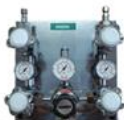
Central Dupla GE CE-200