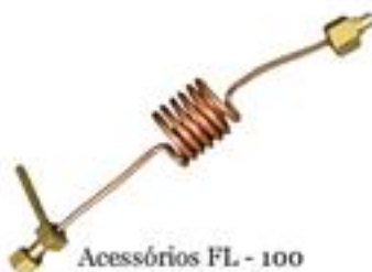
Acessórios FL - 100 Flexível de cobre de 1/4