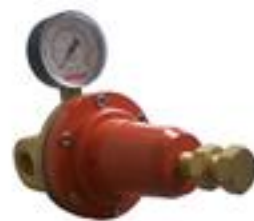
RE - 520 - G Regulador de 3/4 para rede de GLP