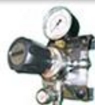
R-51 - SVM-20 D Gases especiais regulador de posto para ajuste fino completo para gases especiais