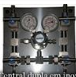
Central dupla em inox CE-2001-GE