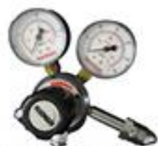
RE-41 Regulador Acetileno p/ solda