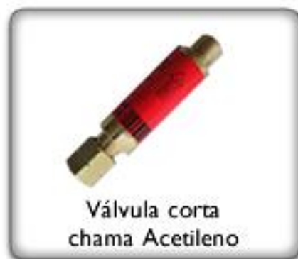
Válvula corta chama Acetileno