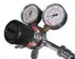
RE100 - Regulador de simples estágio p/ cilindro de gases especiais