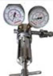
RAP - A Regulador para cilindro de alta pressão de entrada e saída (210 x 210 bar)