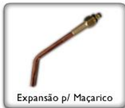
Expansão p/ Maçarico