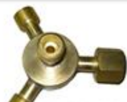
Acessórios Extensão compacta p/3 EC-3