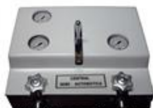
GE CE-500 Central Semi automática