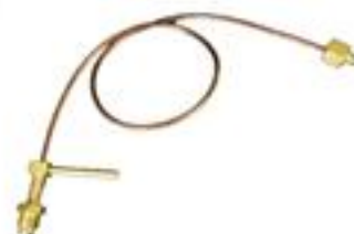
Acessórios CH - 100 Chicote de cobre de 1/4