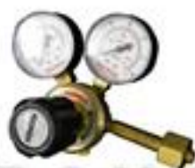
RE-43 Regulador de oxigênio para solda