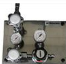
Central Simples GE CE-100