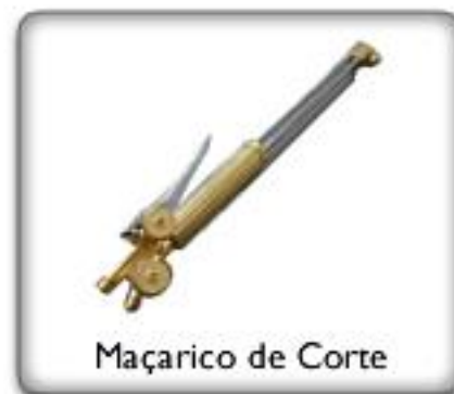
Maçarico de Corte