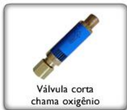
Válvula corta chama oxigênio