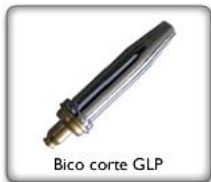
Bico corte GLP