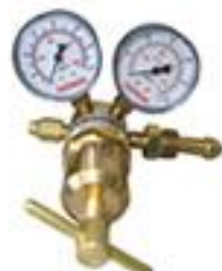
RAP - B Regulador para cilindro de alta pressão de entrada e saída (210 x 100 bar)